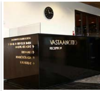
Messinkiset irtokirjaimet, piilokiinnitys (Oulu 10, Oulun Kaupunki)