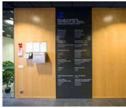
SL-seinäopaste, vaihdettavilla tekstiprofiileilla (Oulun Yliopisto)