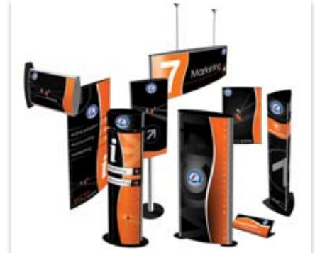
VS-opasteprofiilisarja ulko- ja sisätiloihin. Sarjassa myös AV-opasteita.