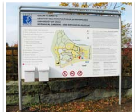
Alumiininen, valaistu IP-ulko-opaste kartalla ja esite- ja palautelaatikoilla