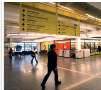
Erikoisvalmisteiset opasteet suojelukoh-teisiin (Oulun Yliopisto)