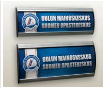
RB-ovenpieliopaste itsevaihdettavalla informaatiopinnalla. RB-opasteista löytyy useita kokoja ja malleja.