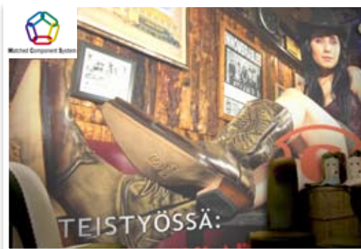
Myymälän sisäteippaus (Kenkämeklari, Oulu)