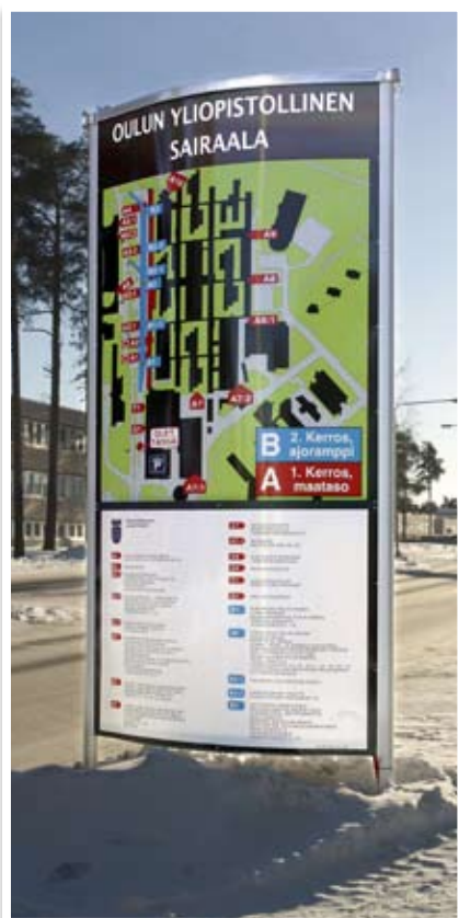
Alumiininen läpivalaistu opasteteemi. OMK-proliiliarja (OYS, Oulu)