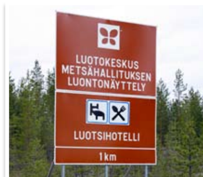
Liikennemerkki (Luotokeskus, Hailuoto) Oulun Mainoskeskus Oy on Tiehallinnon auditoima liikennemerkkien valmistaja.

Opasteiden profiilien mittapiirroksat, sekä yksityiskohtaiset esitteet toimitetaan pyynnöstä.