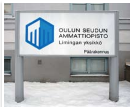
MF-profiiliarjan ulko-opaste, läpivalaistu