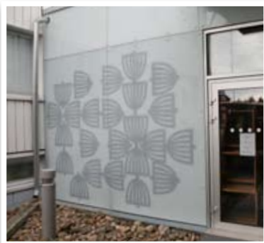
Julkisivuteippaus (Luotokeskus, Hailuoto)