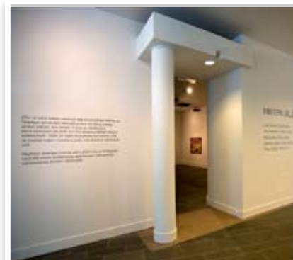
Tarratekstit betoniseinässä (Oulun Taidemuseo)