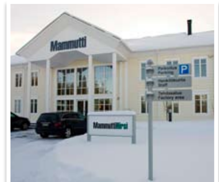
RST Irto kirjaimet, läpivalaistu MF-ulko-opaste ja CF-viitta