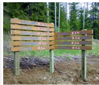
Ulkoiluaueiden opaste, puuhun jyrityt ja maalatut tekstit, alumiiniset kilvet (Hyvinkään Kaupunki)