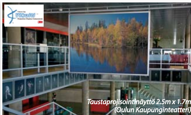
Taustaprojisointinäyttö 2.5m x 1.7m (Oulun Kaupunginteatteri)

Vikuiti-taustaprojisointikalvoja saa myös rullatavarana. Rullien koot ovat seuraavat: pituus 2.5 m, 5.0 m, 10.0 m, korkeus on aina 1.2 m. Tarvittaessa voidaan valmistaa myös suuremmat näyttöpinnat.