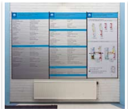
SL-aulaopaste pohjakartalla, vaihdettavat tekstiprofiilit (OSAIO, Oulu)