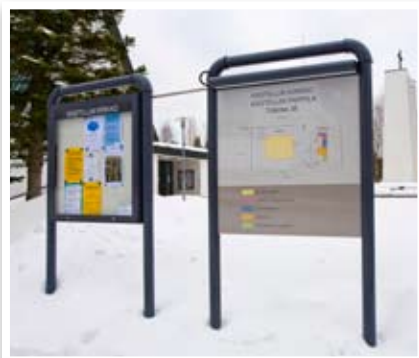
Alumiininen, valaistu ilmoitusvitriini ja valaistu IP-ulko-opaste (Kastellin kirkko, Oulu)