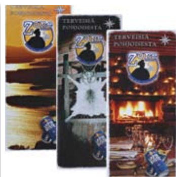
Banderollit (Ravintola Zone, Ruka)

Tulosteet ja kuvasuurenokset toimitetaan halutulla tavalla, rullatavarana tai paikalleen asennettuina. Mainospinnat valmistetaan jokaiseen käyttötarkoitukseen sopiviksi käyttäen juuri kyseiseen tarkoitukseen tarkoitettuja erikoismateriaaleja, olipa kyseessä sitten opasteteippaus, ajoneuvo tai rakennuksen julkisivu.