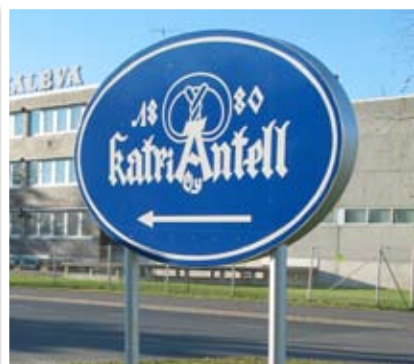
Asiakkaan toivomusten mukaan valmistettu ulko-opaste, alumiinia