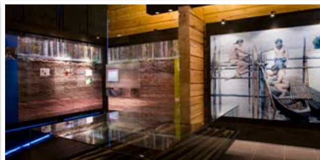
Näyttely- ja valokuvatulostesuurennot (Kierikkikeskus)

Turvakalvot Espoon modernin taiteen museo EMMA:ssa