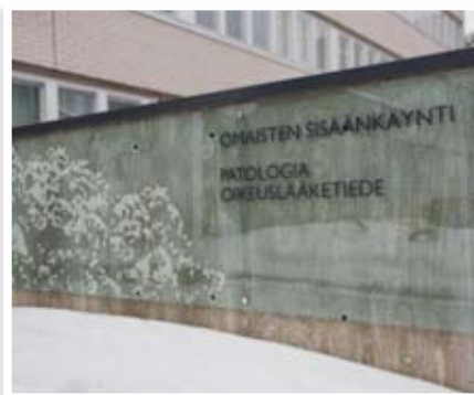
Julkisivuopaste, lasiin teipattu koristekuvio ja opastetekstit (OYS, Oulu)