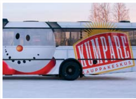
Linja-auton ympäriteippaus (Ruka)