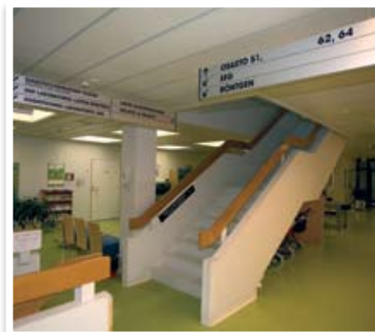
SL-riippuopaste vaihdettavilla tekstilamelilla (Oys, Oulu)