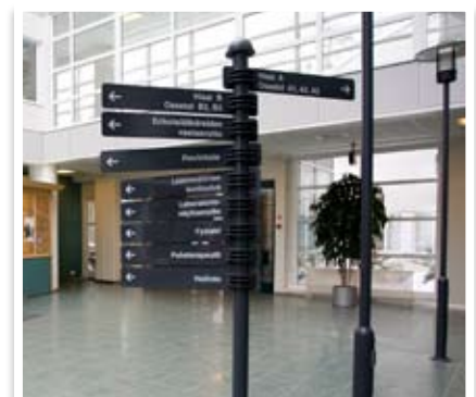
CF-viitat sisä- ja ulkokäyttöön (Oulun Kaupunginsairaala)