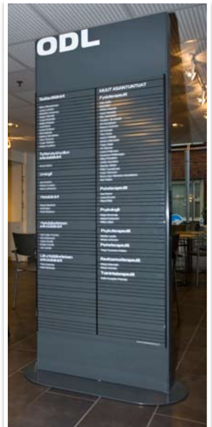
Sisätoteemi, teräsrunko, alumiiniset vaihdettavat tekstiprofiilit (ODL, Oulu)