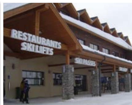
Led-valaistut valomainokset (Ylläs Y1)